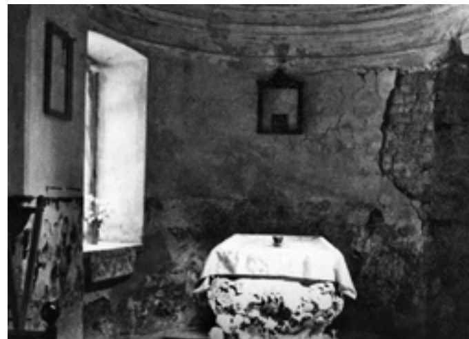
Рака над мощами прп. Илариона Гдовского Июль 1993 года

Первым богослужением был молебен на праздник Казанской иконы Божией Матери 21 июля 1993 года. На молебен пришло около 150 человек, многие плакали от радости – радости просто от того, что были сняты запреты на посещение храмов. После молебна крестилось три человека, один из них впоследствии стал священником Псковской епархии. Но, к сожалению, лишь единицы из пришедших на тот первый молебен стали постоянными прихожанами церкви.