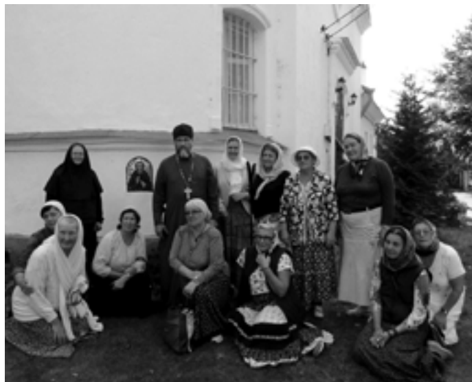
Паломники с острова Залита. 2016 год

А также, молитвенно обращаясь к Пресвятой Богородице в песнопении «Мария, Дево чистая» («Агни парфене»), мы именуем Ее «сосуде тихой радости». Монастырь, основанный преподобным Иларионом в XV веке, и приходской храм, в котором покоятся его мощи, – Покрова Божией Матери.