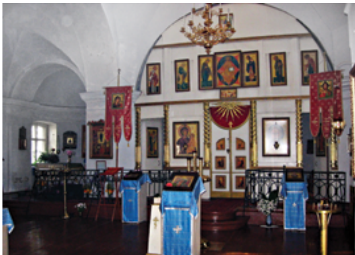
Иконостас. 2000 год