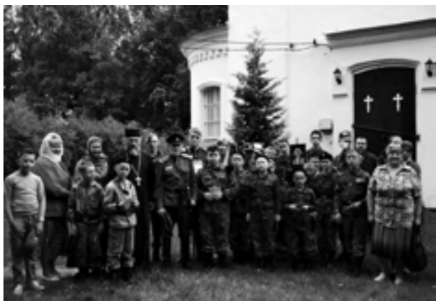
Паломники. 2017 год