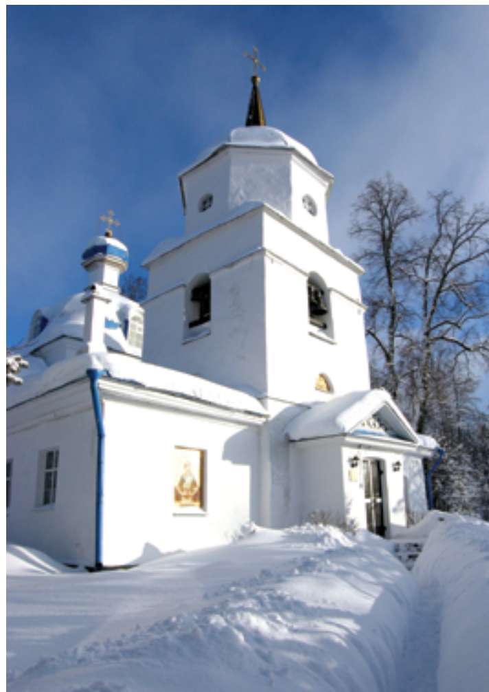
Храм Покрова Божией Матери. Зима 2011 года