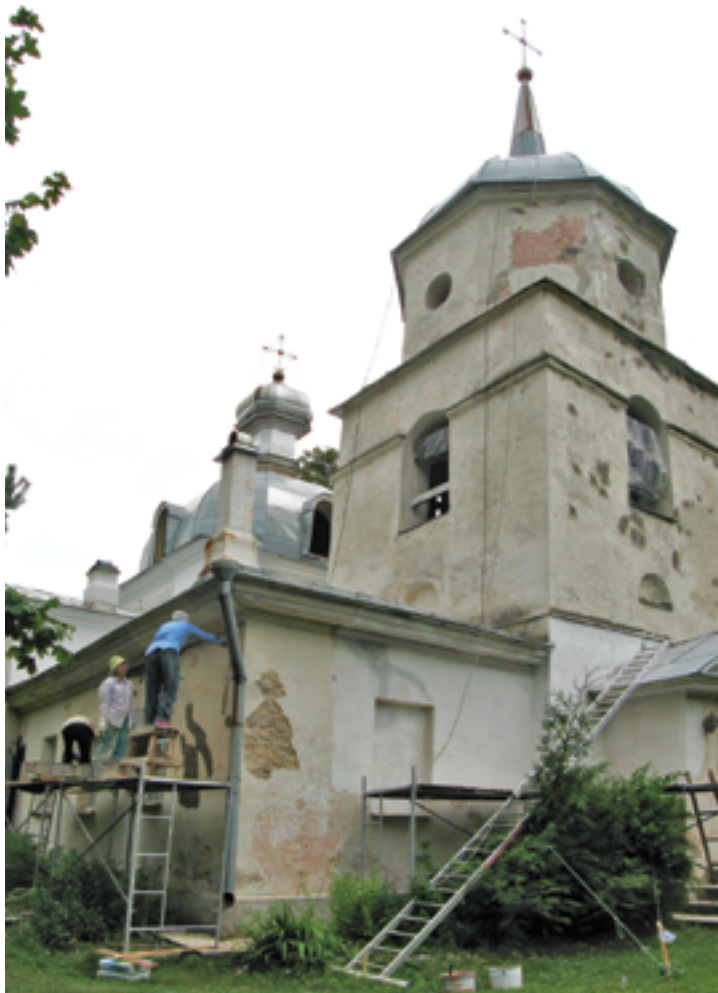
Храм во время ремонта. Лето 2009 года