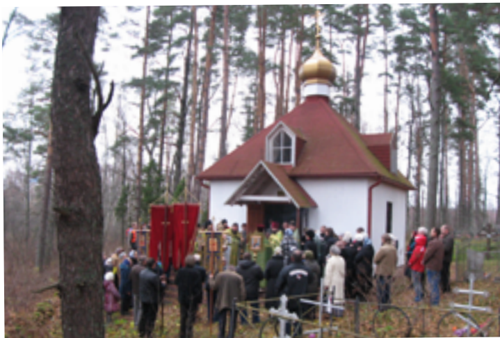
Крестный ход у часовни прп. Илариона Гдовского. 3 ноября 2011 года