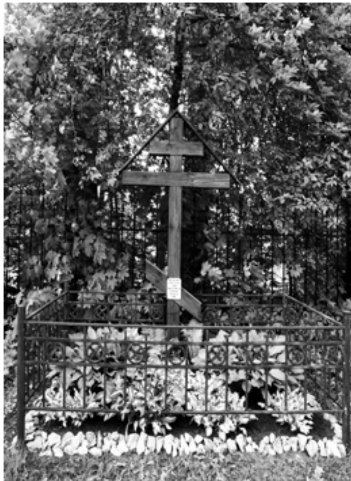
Крест на месте алтаря церкви Рождества Христова. 2018