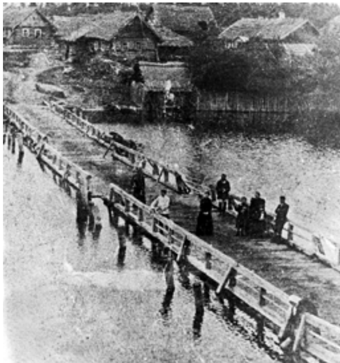
Мост через реку Желчу (д. Озера). Начало XX века

Церковь для крестьян была и школой, и центром культуры. А самым грамотным человеком на селе