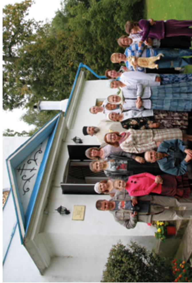
Прихожане после службы. 2013 год