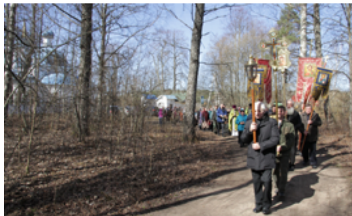
Крестный ход к часовне прп. Илариона Гдовского. 10 апреля 2016 года