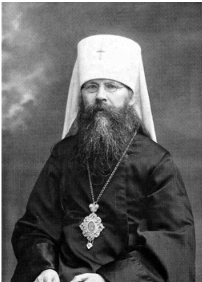
Священномученик Вениамин, митрополит Петроградский и Гдовский

прп. Илариона, построенной вокруг дерева, в котором, по преданию, молился святой. Помимо желания помолиться у мощей прп. Илариона, владыку связывало с этим удаленным уголком Петроградской епархии то, что с 1913 года до лета 1917 года в Покровской Озерской церкви служил его младший брат – священник Григорий Казанский. После окончания Санкт-Петербургской Духовной семинарии он поступил на медицинский факультет Юрьевского (ныне Тартуского) университета, но не окончил его. В прошении на имя митрополита Санкт-Петербургского и Ладожского Владимира (Богоявленского) он писал: