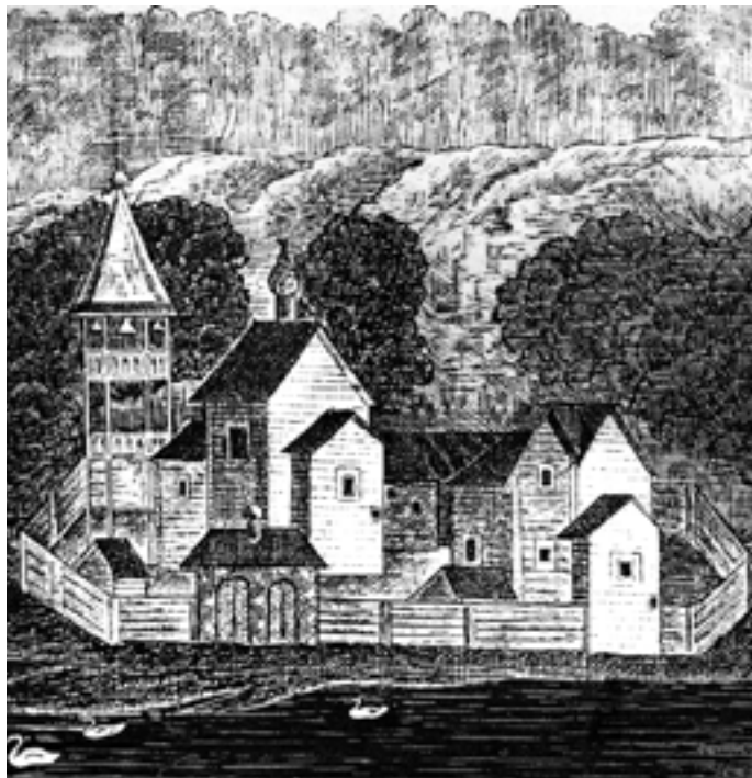
Обитель прп. Илариона. Рисунок с иконы XVII века

В 1470 году (по другим данным – в 1440 году) здесь был основан Покровский Княже-Озерский мужской монастырь, а преподобный Иларион стал его игуменом. При его жизни в монастыре были возведены две церкви – Покрова Божией Матери и Рождества Христова.