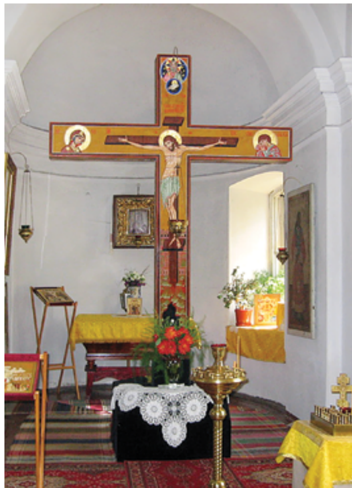
Восстановленное распятие. 1998 год