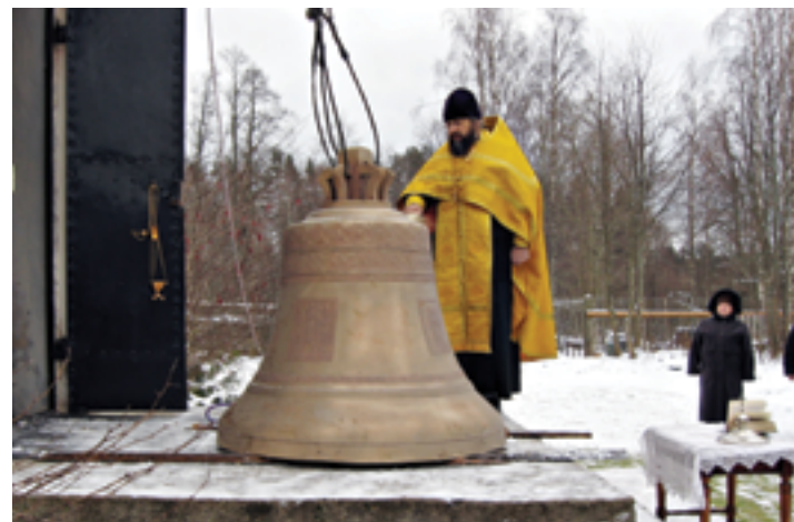
Установка большого колокола (1140 кг). Ноябрь 2007 года