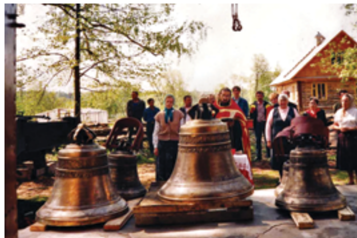
Освящение колоколов. Май 1996 года