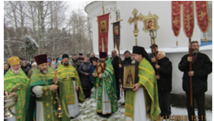
Крестный ход в день прп. Илариона Гдовского. 3 ноября 2016 года