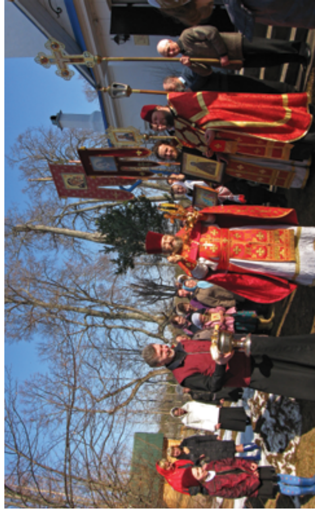
Крестный ход в день памяти прп. Илариона Гдовского. 10 апреля 2010 года