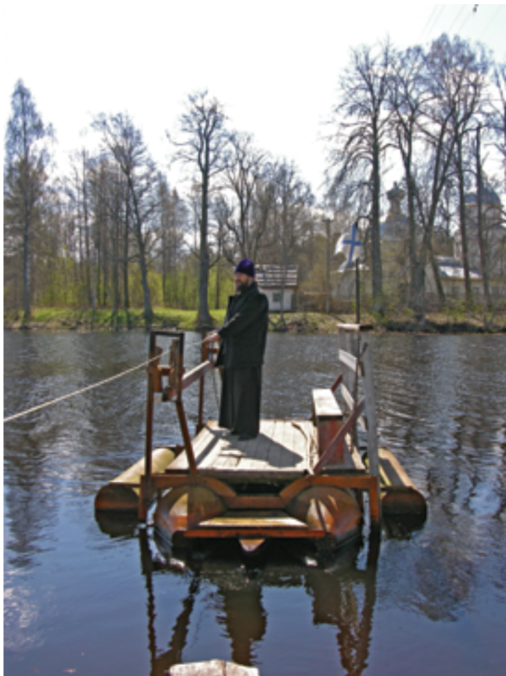
Паром через реку Желчу