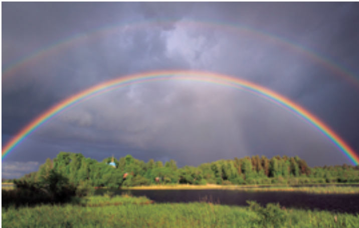
Радуга над храмом