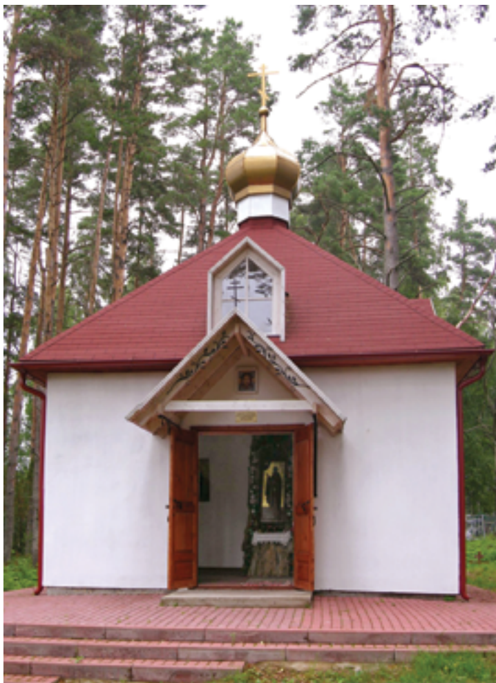
Часовня памяти прп. Илариона Гдовского. Осень 2005 года