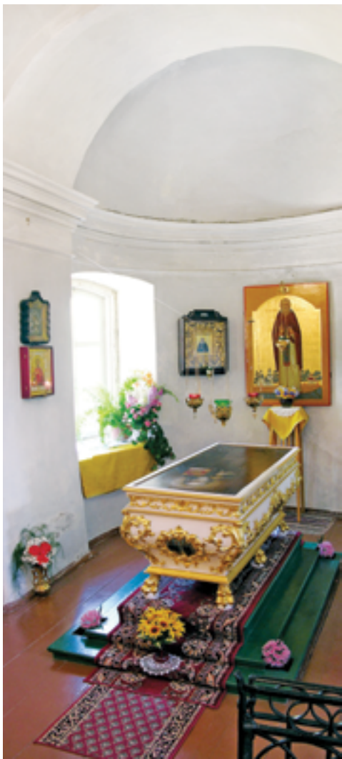
Рака над мощами прп. Илариона Гдовского. 2009 год