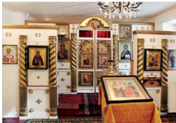
Зимний храм после ремонта. 2011 год