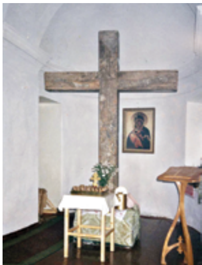
Распятие. Изображение утрачено 1995 год