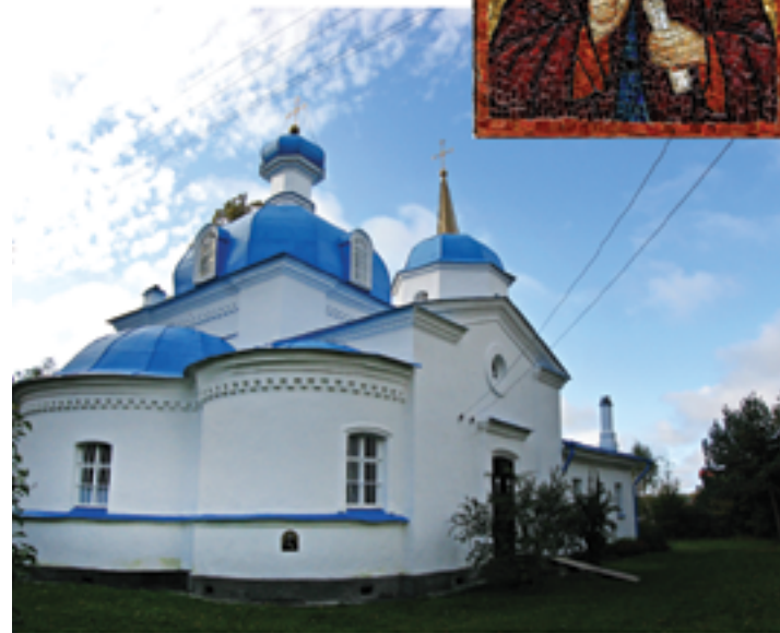
Мозаичная икона при. Илариона Гдовского в стене храма над местом захоронения святого, 2009 год