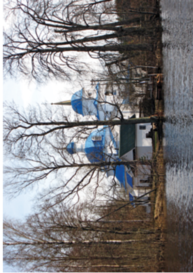
Вид на храм с реки Желтчи. Апрель 2010 года