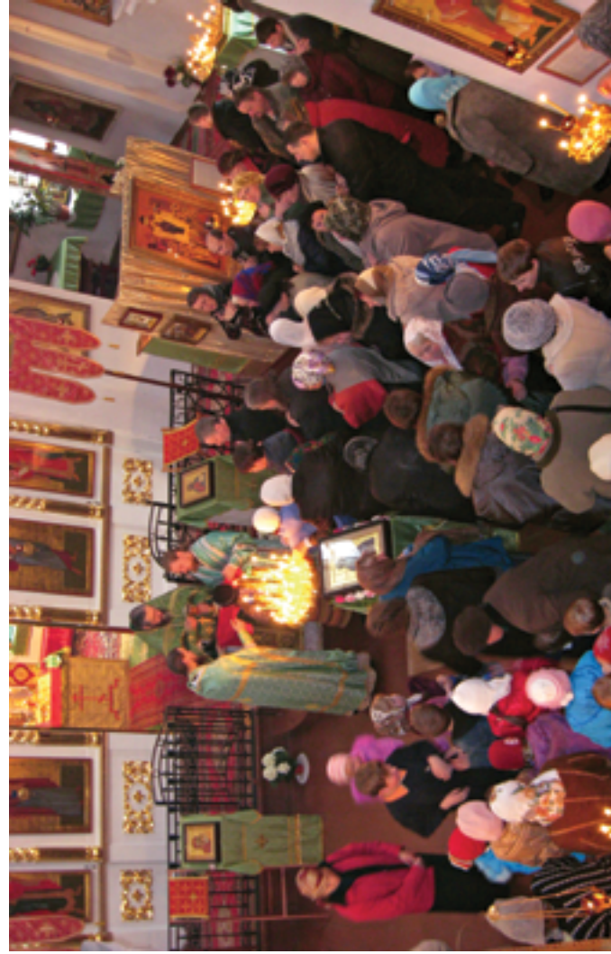
Причастие. 3 ноября 2008 года