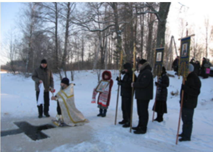
Крещение Господне. Иордань на реке Желче. Зима 2009 года