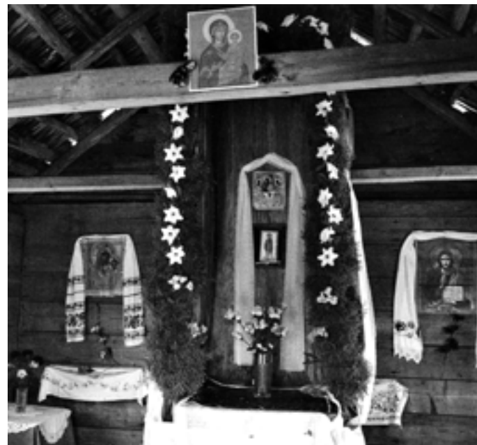
Ствол сосны, в дупле которой, по преданию, молился прп. Иларион Гдовский. Деревянная часовня, 1994 год

И православный крест на куполе часовни видимым образом говорит нам о победе истины над заблуждениями. Посещая часовню памяти прп. Илариона Гдовского, каждый из нас должен в своем сознании отделить христианство от мифологии и язычество – от веры в Истинного Бога.