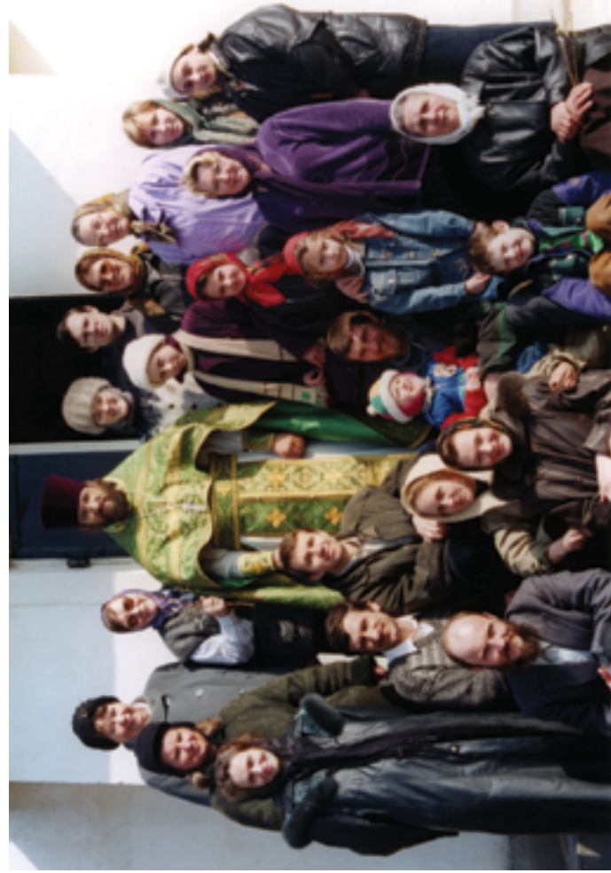
У входа в храм. 3 ноября 2001 года