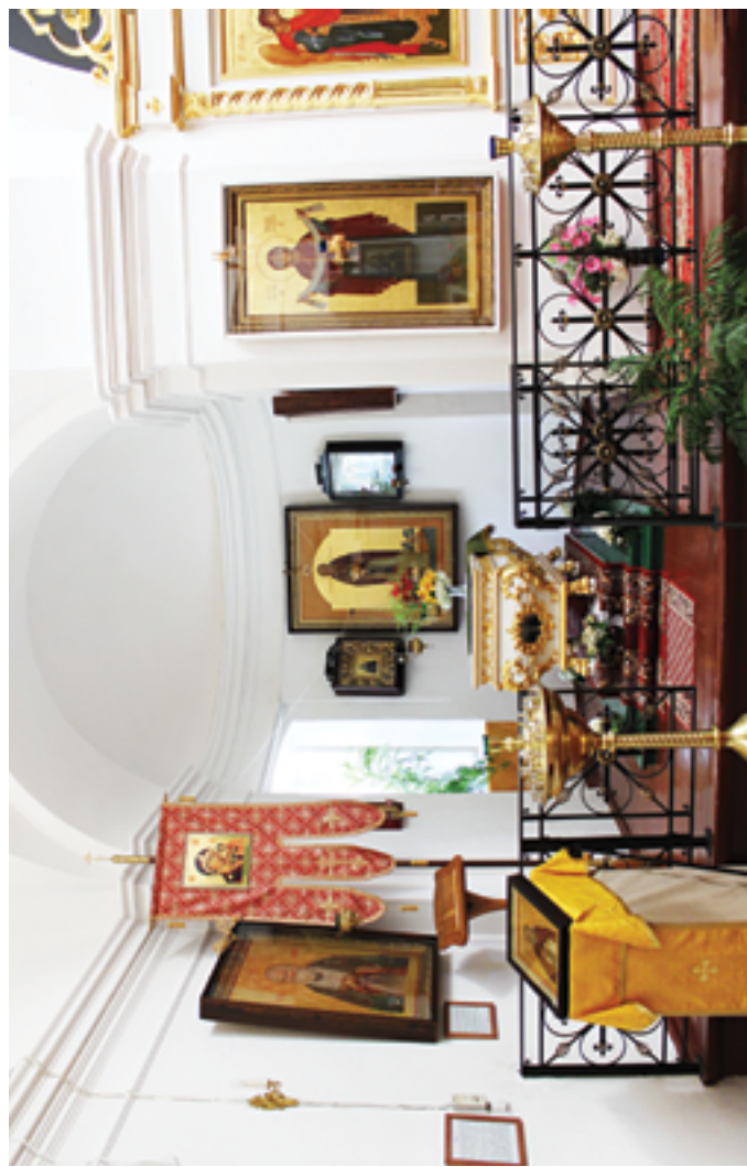
Храм после ремонта. 2009 год