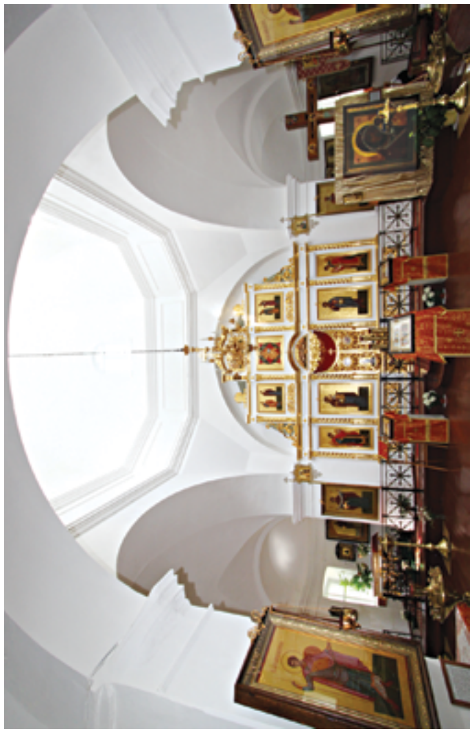
Храм после ремонта. 2009 год