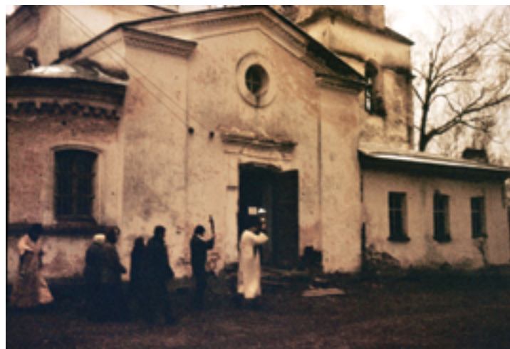
Крестный ход 3 ноября 1993 года