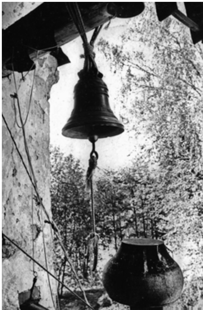
Колокольня Покровской церкви в 1994 году