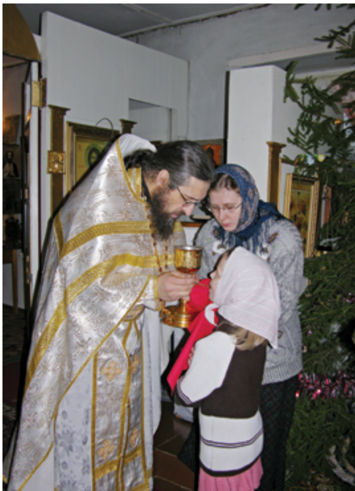
Причастие. Рождественская служба в зимнем храме Рождества Христова. 2005 год