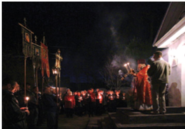
Крестный ход на Пасху. Май 2013 года