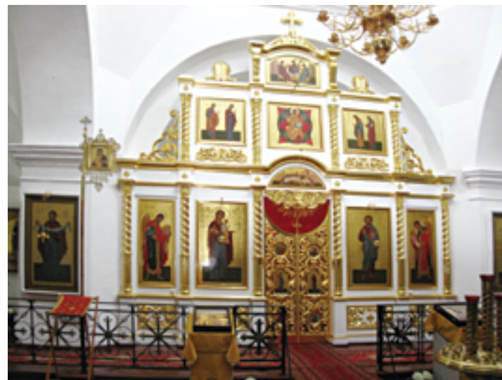
Новый иконостас. Осень 2009 года