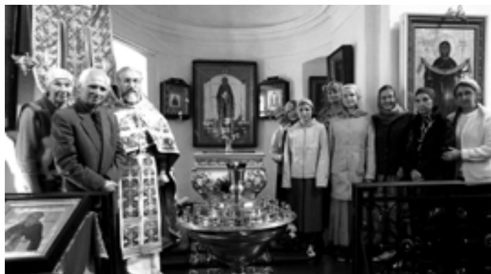
Около раки при. Илариона Гдовского. 2017 год