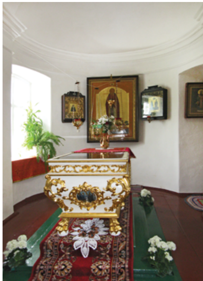
Рака при. Илариона. 2010 год (реставрация осуществлена в 1996 году)