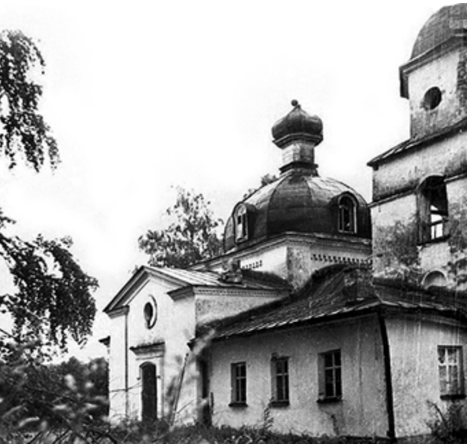
Вид церкви Покрова Божией Матери д. Озера в начале 1990-х годов