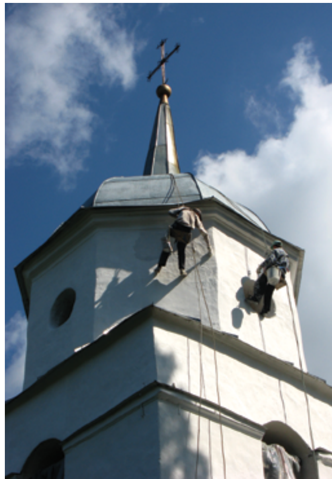
Альпинисты на ремонте колокольни. Лето 2009 года