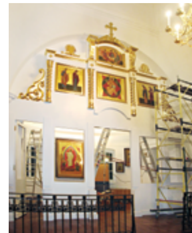
Окончательный монтаж иконостаса. 24 августа 2009 года