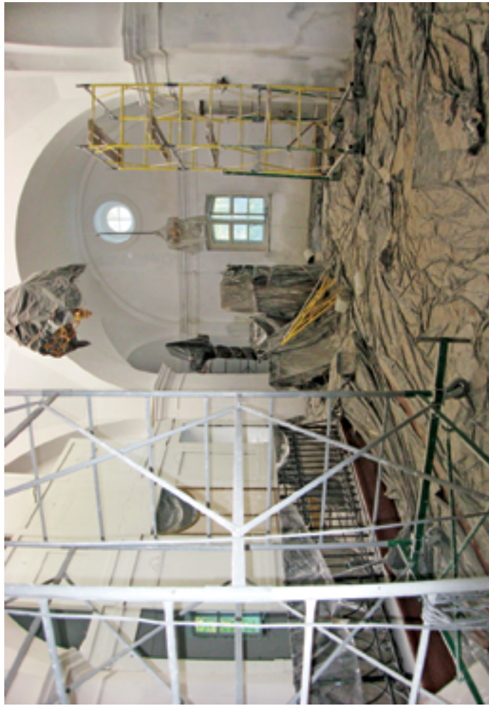
Ремонт внутри храма. Июль 2009 года