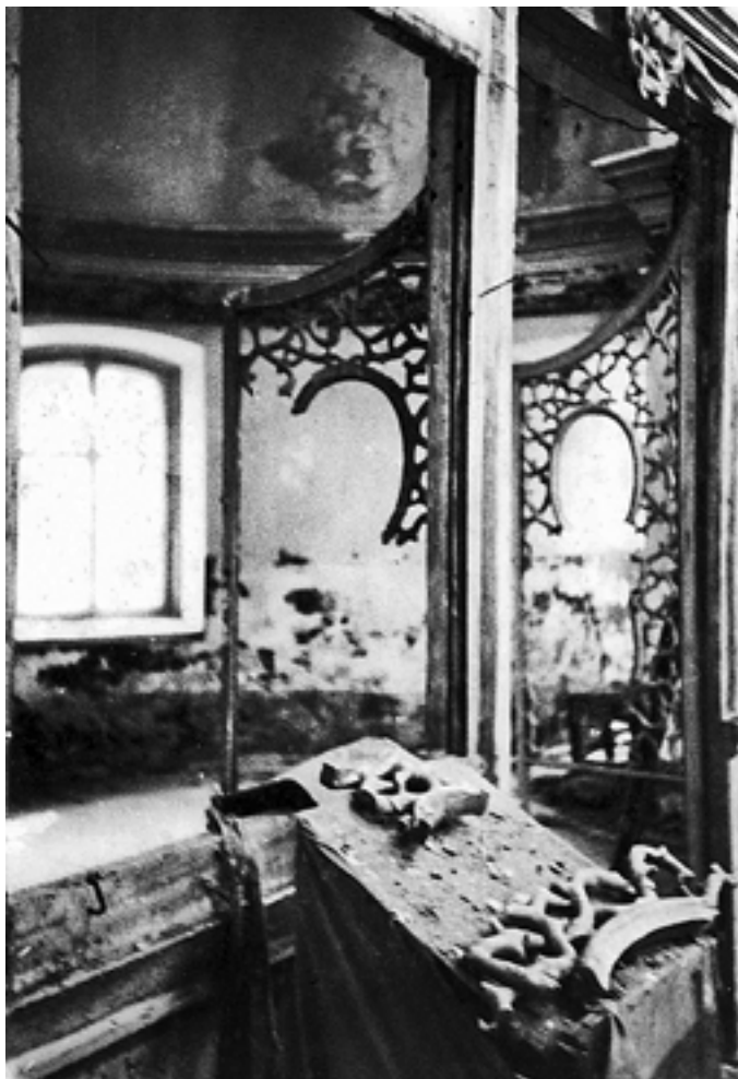
В церкви Покрова Божией Матери в 1991 году.

После ухода монахини Ираиды в жизнь вечную храм подвергся полному разграблению. Местные жители рассказывали, что в 1970-е годы подъезжали грузовики, на которых и были вывезены в неизвестном направлении иконы и остатки утвари из церкви Покрова Богородицы.