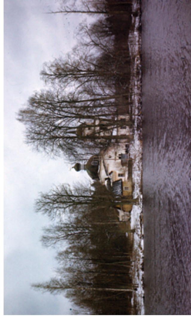
Церковь Покрова Божией Матери д. Озера. Весна 1993 года