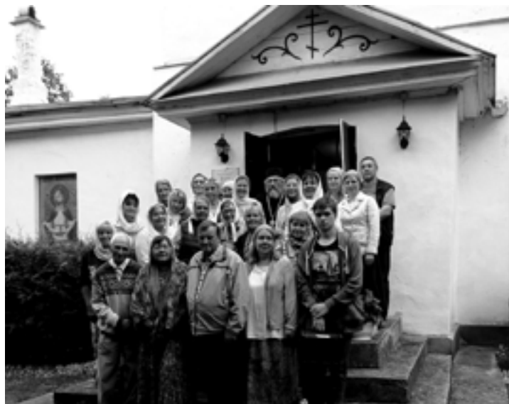
Прихожане у входа в храм. 2018 год