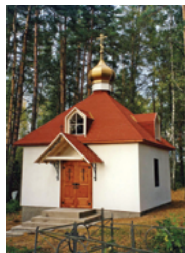
Старая часовня памяти прп. Илариона Гдовского. 1999 год