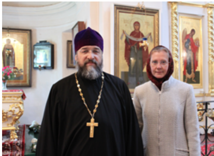
Ремонт храма 2012 года