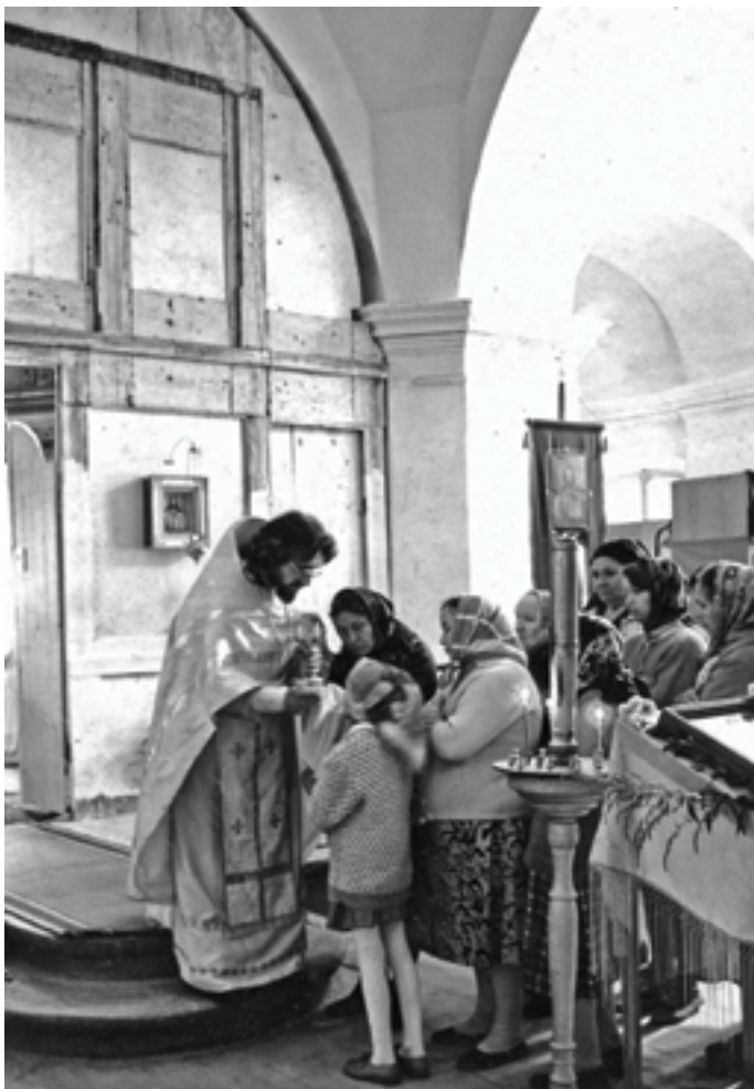
Причастие. Лето 1994 года