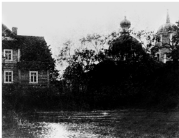
Дом священника около церкви. Начало XX века

В приходе имелось два кладбища: одно – в церковной ограде (наверное, для священников, которые служили в этой церкви, и монахов закрытого в XVIII веке монастыря), другое – недалеко от церкви, вокруг часовни прп. Илариона.