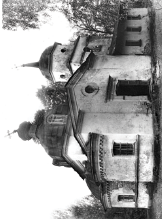
Церковь Покрова Божией Матери до ремонта. Июль 1993 года