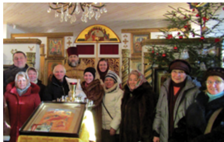
Рождество Христово. 2017 год