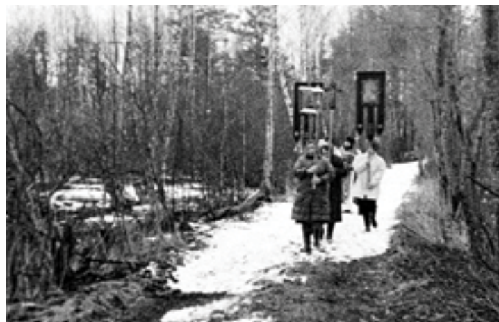
Крестный ход в часовню на праздник прп. Илариона. 10 апреля 1995 года