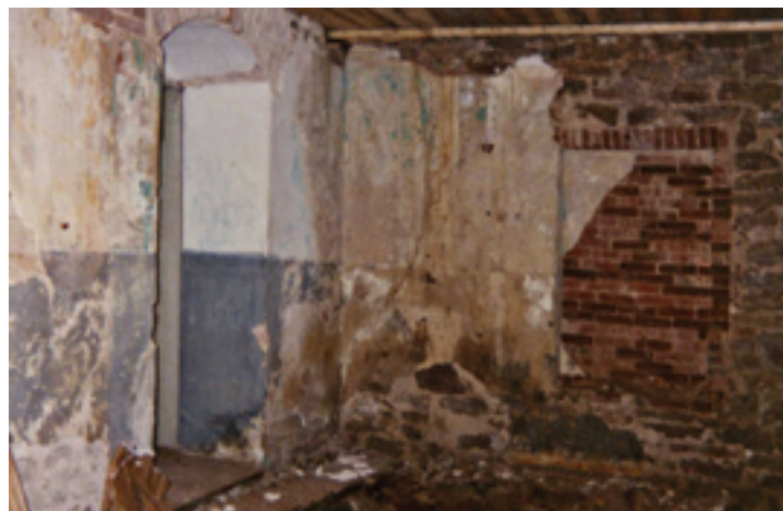
Зимний храм Рождества Христова после разбора завалов. 1994 год