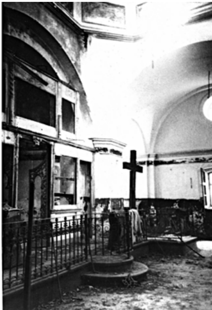
Церковь Покрова Богородицы. 1991 год

В большинстве случаев инициаторами передачи разрушенных храмов были верующие люди, а не государство. Просто стояли никому не нужные руины храмов как жуткие памятники атеизму, поразившему наш народ. И вот у некоторых людей появилось непреодолимое желание молиться в этих местах. Они стали регистрировать приходы церквей, и тогда государство передавало Церкви эти руины. И начинались ремонтные работы и богослужebная жизнь. Таким образом, в основе внешнего восстановления лежит вера и воля конкретных людей. Это время еще ждет своего исторического и духовного осмысления и оценки.