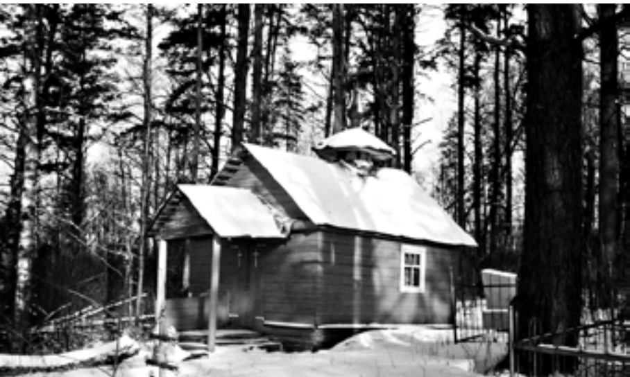
Часовня памяти прп. Илариона. 1996 год

В конце 80-х годов XX века местные жители деревни Озера покрыли крышу на старой часовне