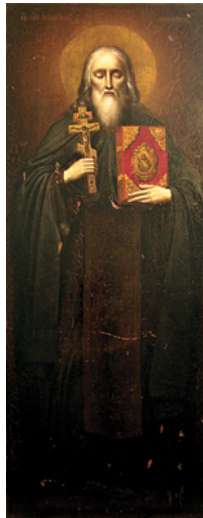
Икона прп.Илариона Гдовского, находящаяся на раке святого