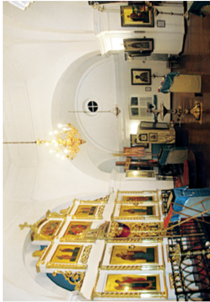
После ремонта. Осень 2009 года