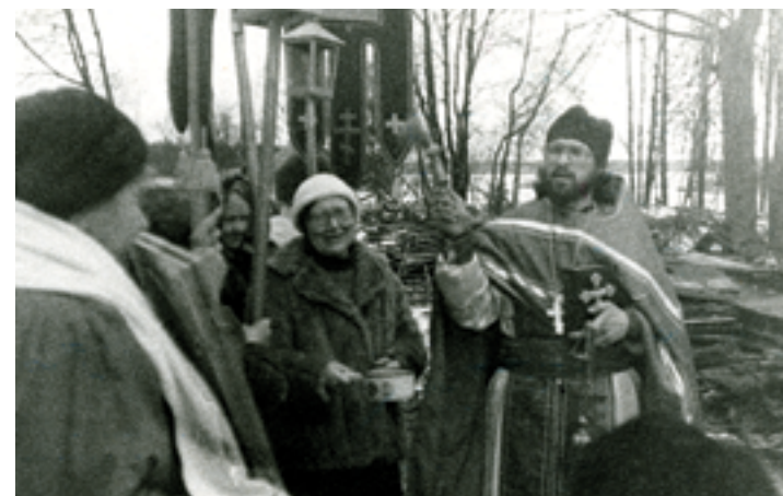
Крестный ход 3 ноября 1995 года