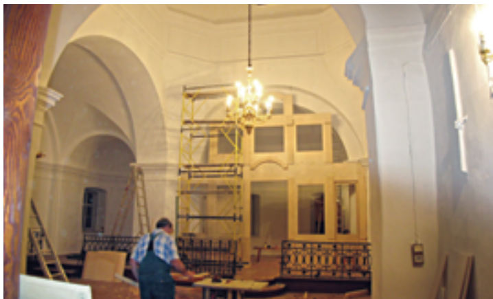
Работы по возведению новой основы иконостаса. Август 2009 года