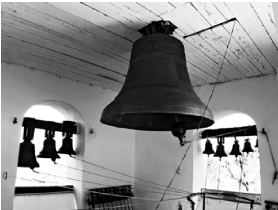
Колокола церкви Покрова Божией Матери. 2007 год