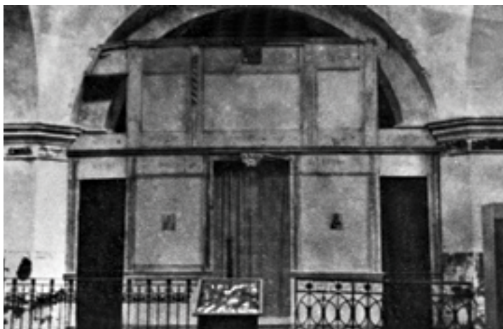
Остатки иконостаса церкви Покрова Божией Матери. 1991 и 1993 годы