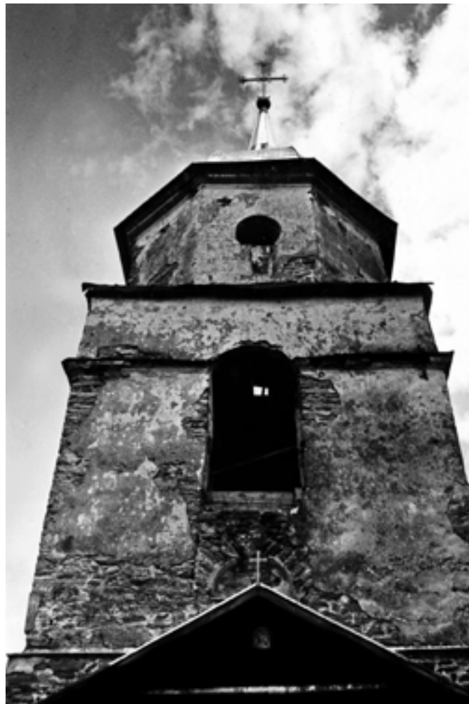
Колокольня Покровской церкви. 1995 год

Параллельно выносили мусор из церкви, чистили печи в храме, вместо стекол рамы были затянуты полиэтиленовой пленкой. Тогда же была сооружена новая стропильная система на двух приделах церкви.