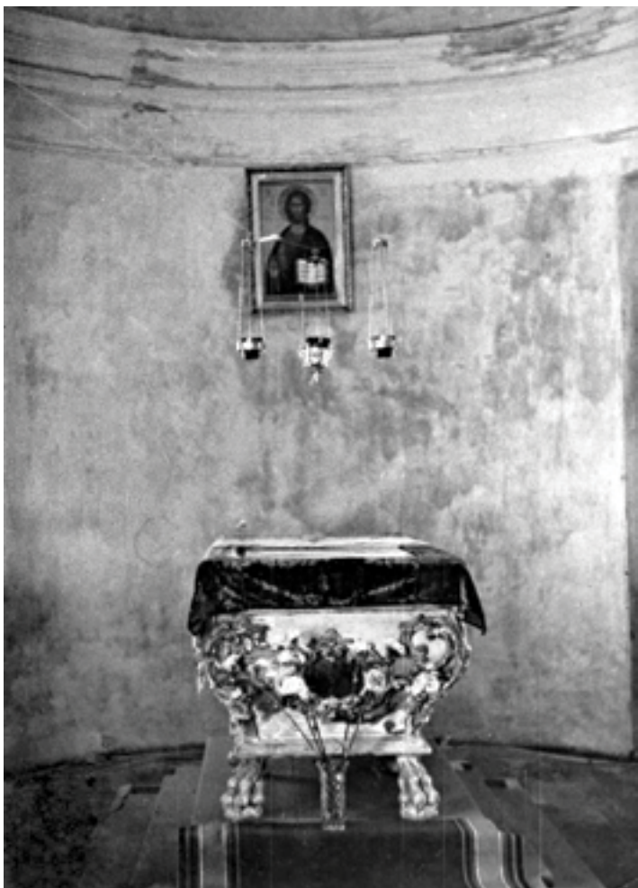
Рака при. Илариона до реставрации. Август 1994 года