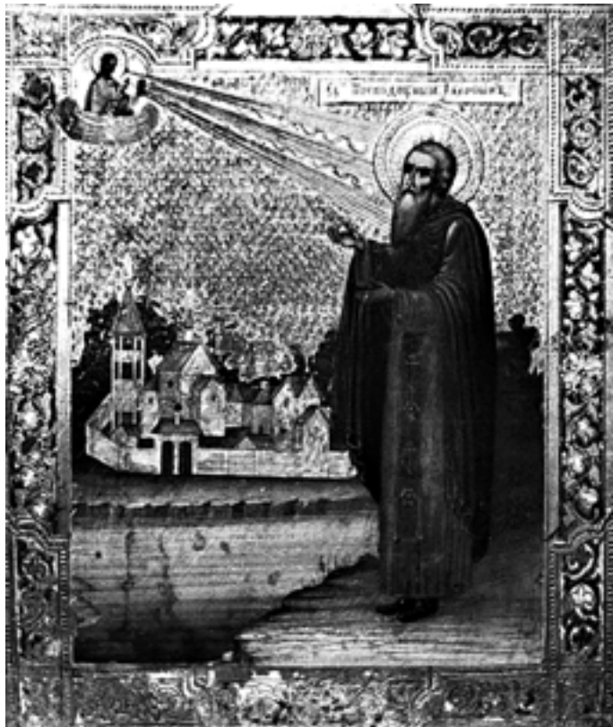
Одна из утраченных икон часовни «Преподобный Иларион Гдовский»