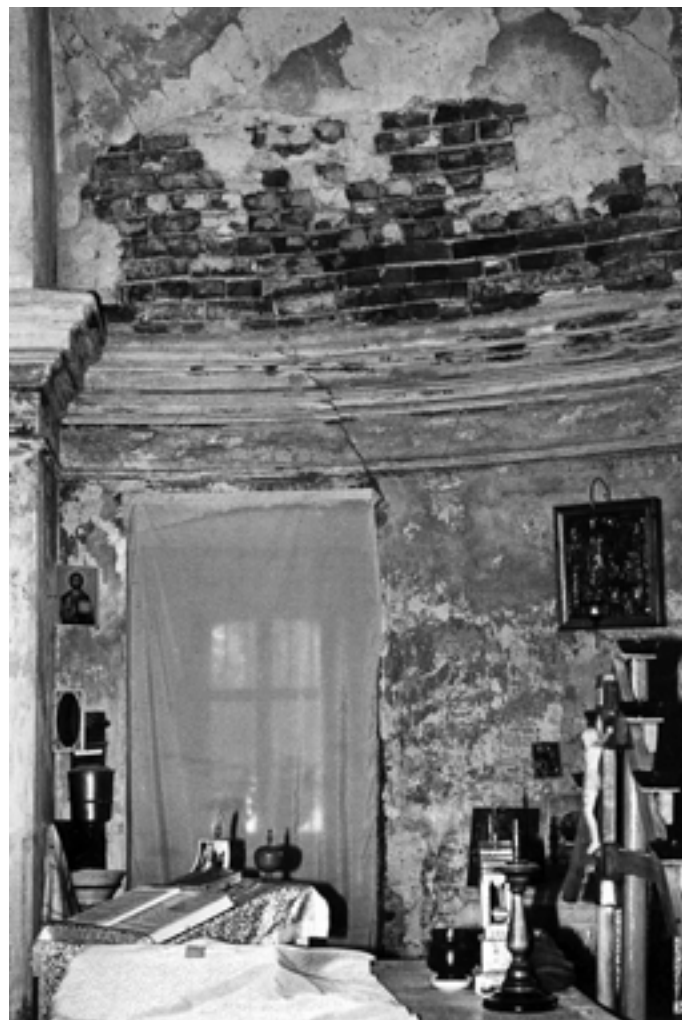
Алтарь храма Покрова Богородицы. 1993 год