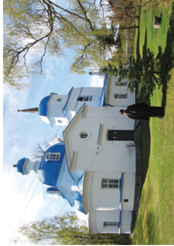
Храм Покрова Божией Матери после ремонта. 2010 год