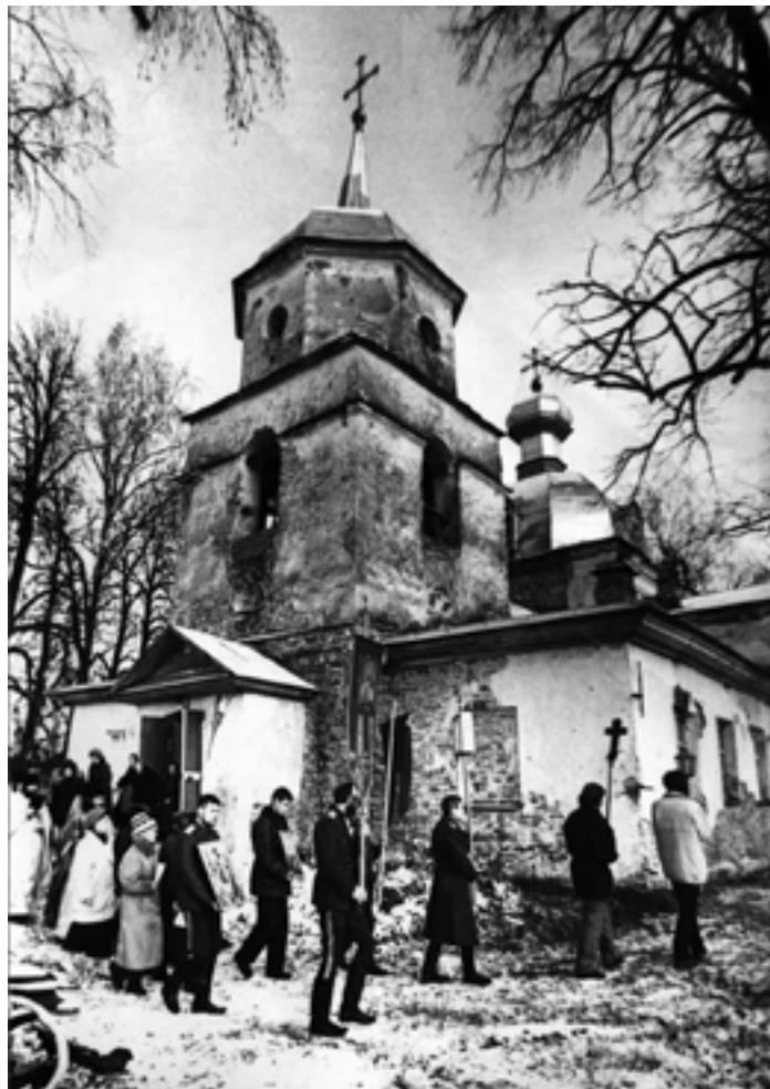
Крестный ход на праздник при. Илариона 3 ноября 1995 года

В сентябре–ноябре 1994 года был произведен ремонт в правом приделе: сделаны пол, печка,