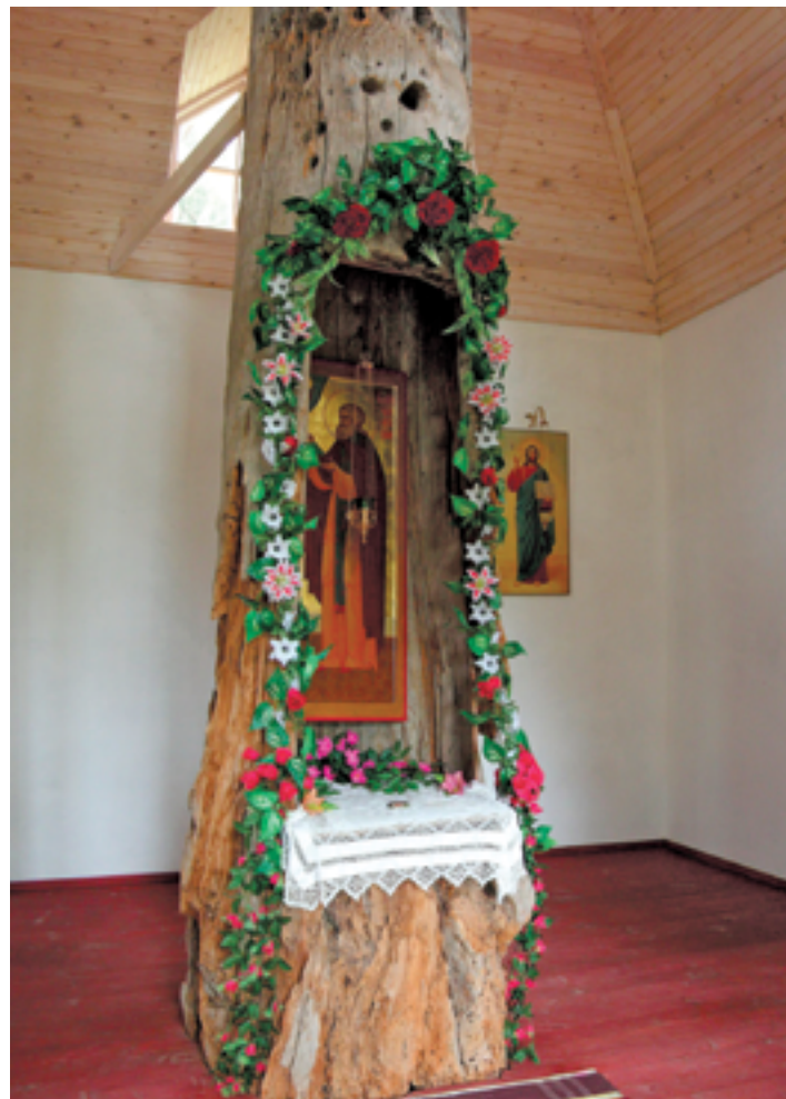
Сосна, в дупле которой молился прп. Иларион Гдовский, находящаяся внутри часовни.