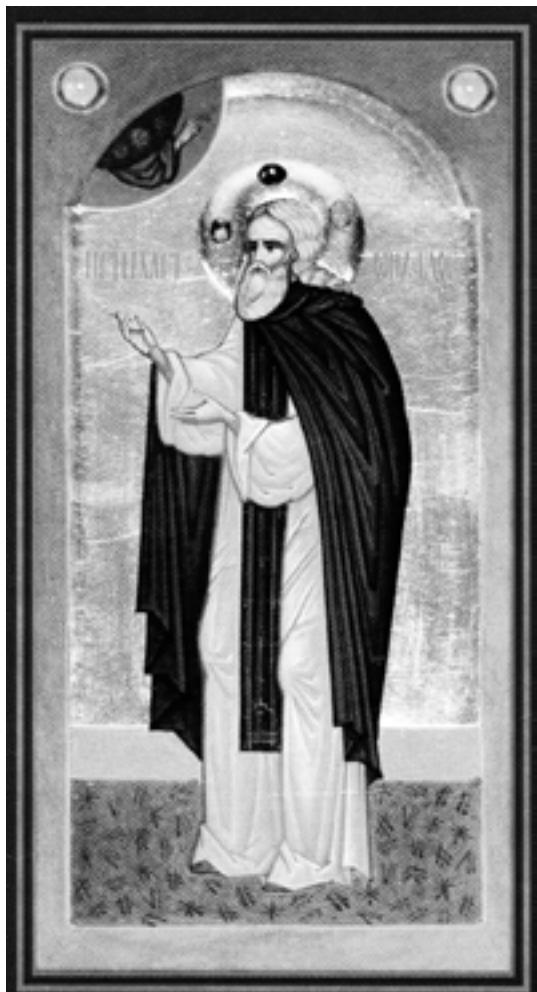
Икона прп. Илариона Гдовского

Так родилась «русская Фиваида» 1 XIV–XV веков – лесная пустыня, освященная подвигами русских подвижников.