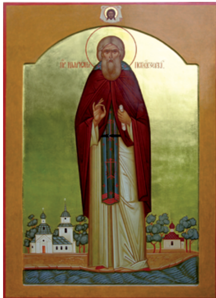
Икона прп. Илариона Гдовского, Псковоезерского, находящаяся в храме Покрова Божией Матери за ракой святого

Из фотоархива 1993–2018 годов церкви Покрова Божией Матери деревни Озера